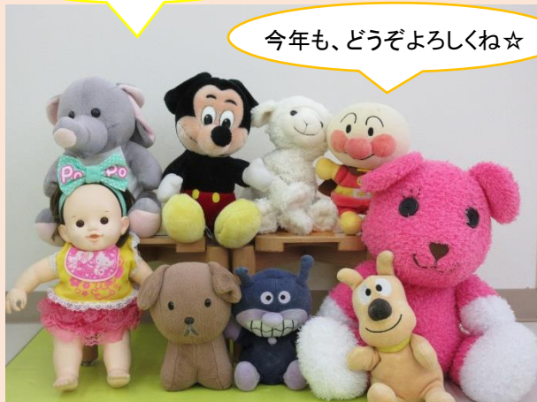
ままごとコーナーのひとコマより